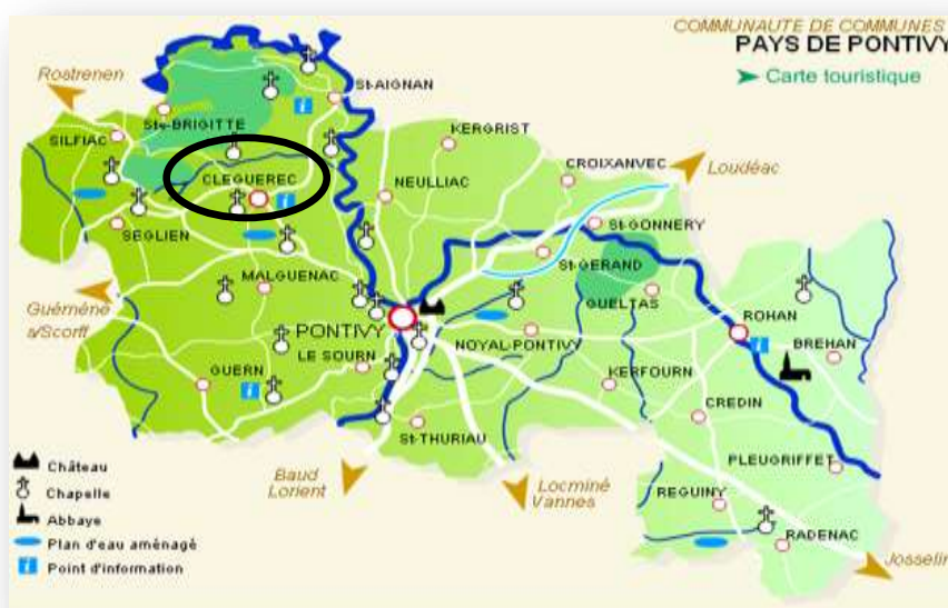
Carte de la Communauté de Commune du Pays de Pontivy.

C'est dans un territoire dynamique que l'association s'implante. La commune de Cléguérec est peuplée de 2 835 habitants, située sur le Pays de Pontivy (communauté de communes du Pays de Pontivy, qui regroupe 24 communes totalisant 44 662 habitants) à une heure de route des villes de Vannes, Lorient et Saint Brieuc.